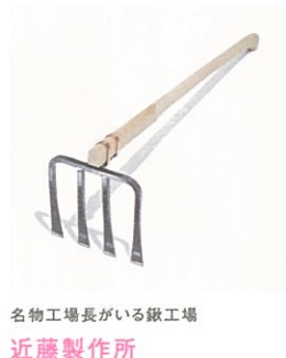
名物工場長がいる鍛工場 近藤製作所