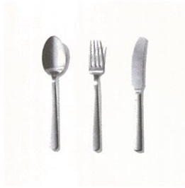
カイ・ボイスンのカトラリーも製造 大泉物産