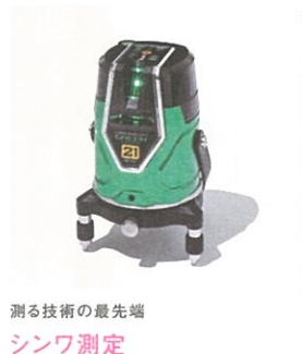
測る技術の最先端 シンワ測定