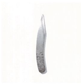
知る人ぞ知る「切出」の奥深き世界 増田切出工場