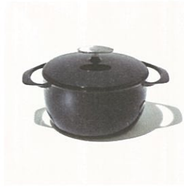
世界最軽量を誇る鋳物ホーロー鍋工場 三条特殊鋳造所