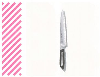
世界的に評価を受ける「藤次郎」の包丁 藤次郎