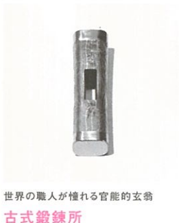
世界の職人が憧れる官能的玄翁 古式鍛錬所